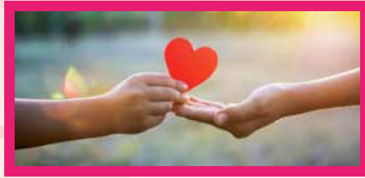
「一張旗紙,一份祝福。」