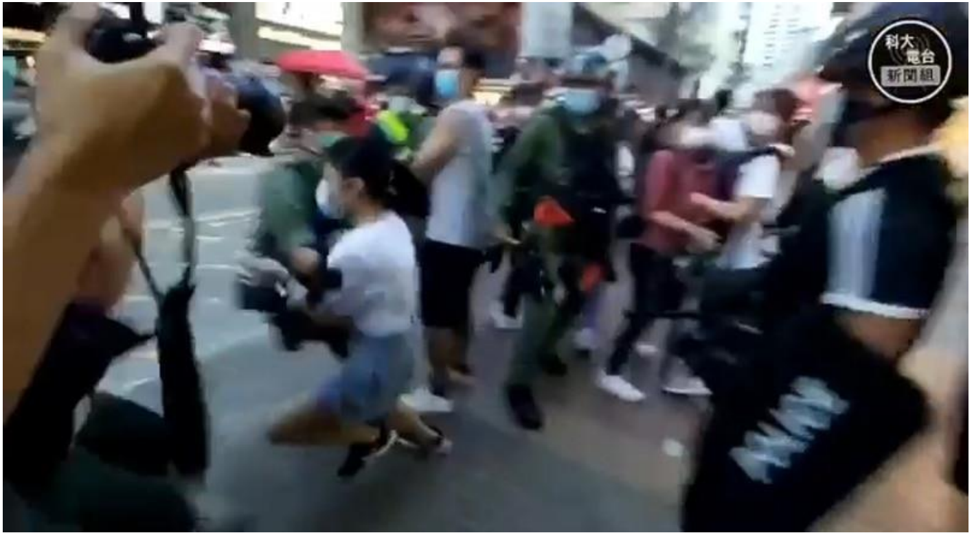
骨科醫生翻看事發片段後表示，女童明顯被撞倒失去重心、身體後傾，後腦最先着地，隨時有腦震盪之虞。