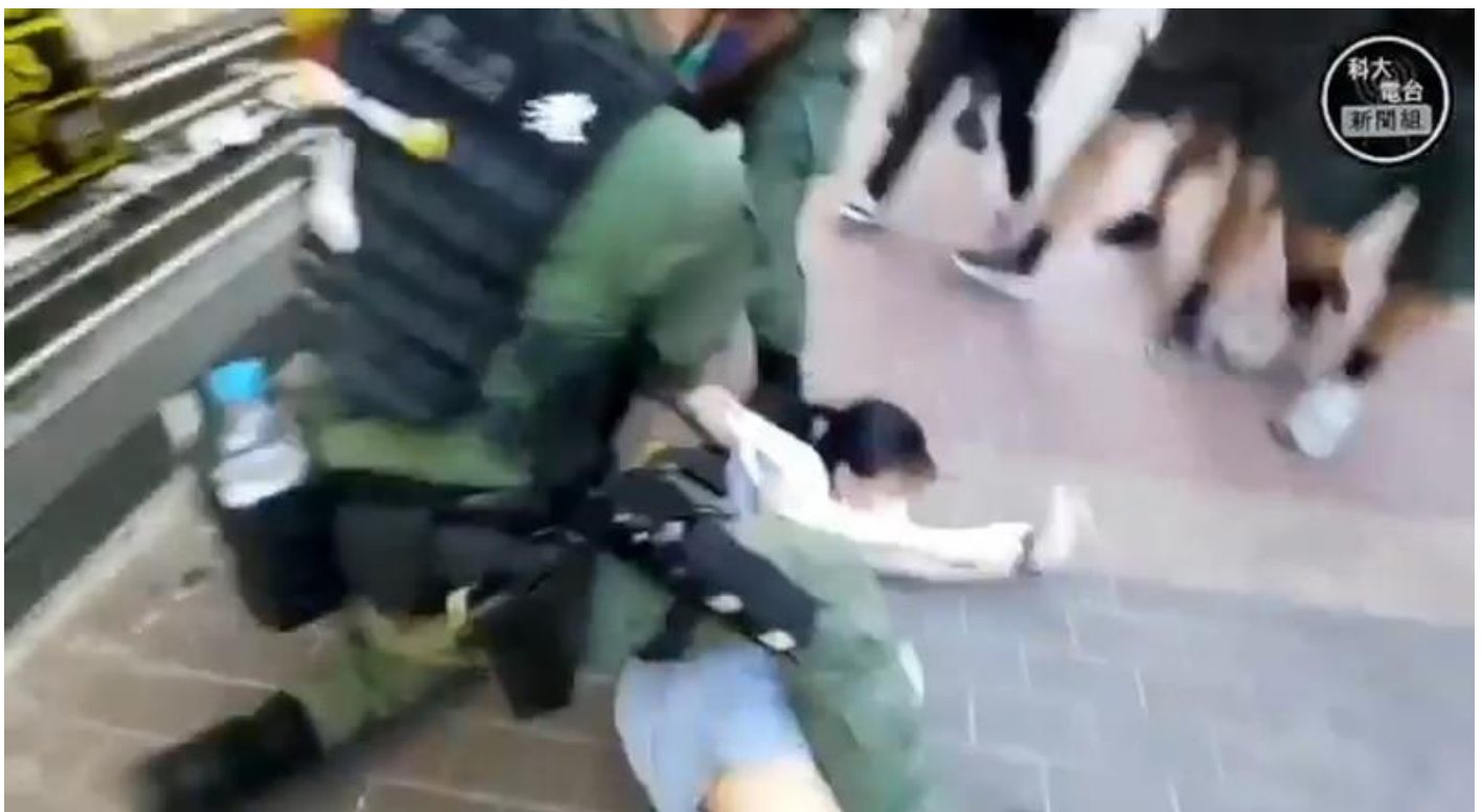
女童被迎面撞上的防暴警撲至後腦着地。